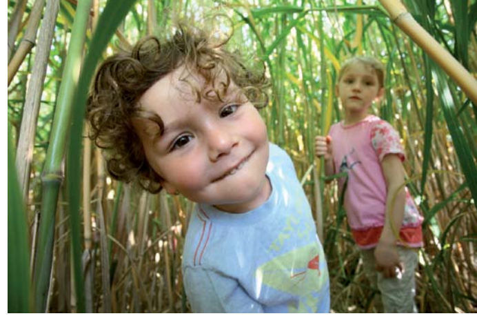
Viel Spielflächen für Kinder

Angebote stehen für Kinder während der Sommerferien zur Verfügung, um sich der Natur zu nähern. Vier Spielflächen, darunter ein Wasser- und Kletterspielplatz sowie eine Skaterplaza bieten ausreichend Raum für Spiel, Spaß und Bewegung. 3.000 Veranstaltungen begleiten die BUGA das Jahr hindurch.