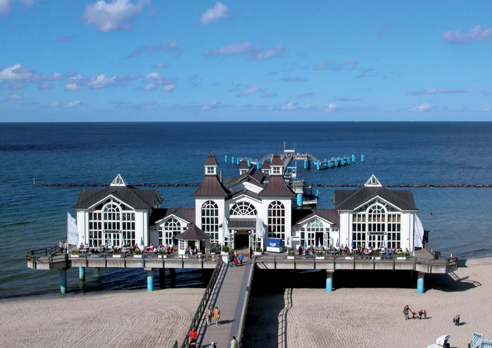
Die Seebücke Sellin