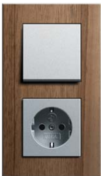
Die neuen Rahmenvarianten Nussbaum-Aluminium

Für einen glanzvollen Auftritt an der Wand sorgen auch die Rahmenvarianten in Aluminium, Chrom und Messing. Unterstreichen sie doch die zeitlose, distanzierte und elegante Note, je nach Wunsch und Ausstattung. Allen Rahmenvarianten gemein ist ihr vielfältiger Einsatz. Mehr als 280 Funktionen können in das Schalterprogramm installiert werden und bieten damit höchste Flexibilität für alle Anforderungen in der intelligenten Gebäudetechnik.