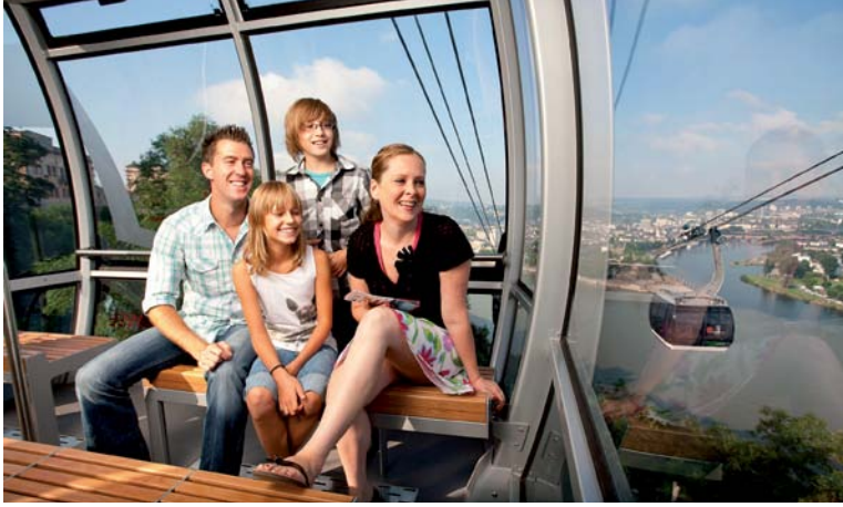
Mit der Seilbahn über den Rhein