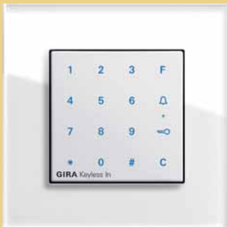
Gira Keyless In Codetastatur