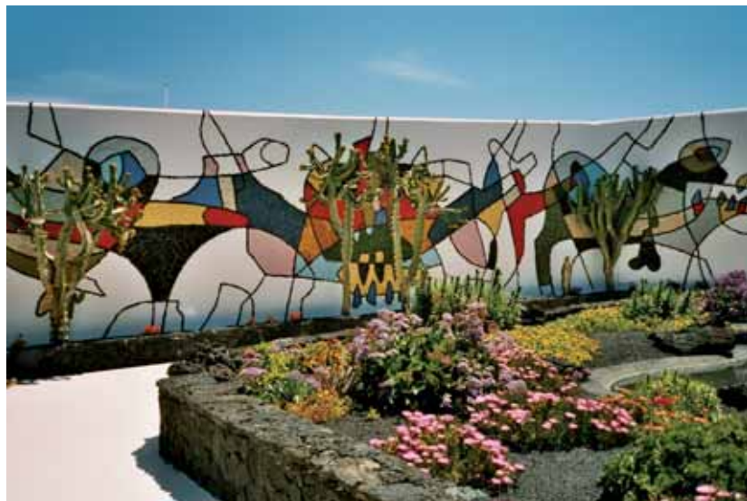
Die Handschrift des Künstlers César Manrique prägt die Insel

Gut essen vielleicht noch. Zum Beispiel frischen Fisch, direkt vom Boot ins Restaurant gereicht. In einem Fischrestaurant im Hafen von Arrieta kann man nicht nur vorzüglich, sondern auch äußerst preisgünstig speisen: Die berühmte Mojo-Sauce darf da nicht fehlen, ob verde (grün und mild) oder rojo (rot und scharf), Papas arrugadas (in Meerwasser gekochte Kartoffeln) zu Seezunge, dazu ein Glas Malvasia-