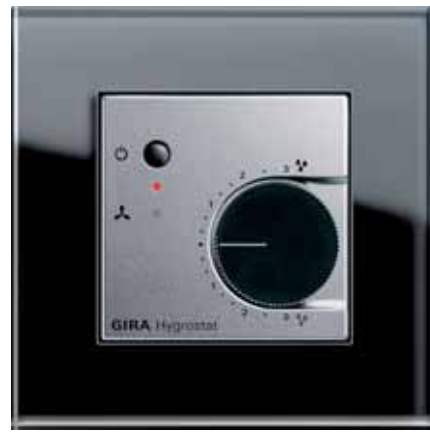
Der Gira Hygrostat sorgt für ein gesundes Raumklima.

Dabei ist die Luftfeuchtigkeit ein wichtiger Wohlfühl-Faktor in einem Raum. Zu niedrige trocknet die Atemwege und Schleimhäute des Menschen aus. Die sind dann bester Nährboden für Infektionen aller Art, insbesondere Erkältungen. Zu hohe Luftfeuchtigkeit wird schnell als drückend empfunden. Sie entsteht bei zu wenig Lüften, da der Mensch von sich aus bereits eine nicht zu vernachlässigende Wasserdampfmenge an die Luft abgibt. Eine Familie mit vier Personen gibt täglich bis zu zehn Liter Wasser als Wasserdampf in die Umgebung ab. Pro Woche entspricht das einer gefüllten Badewanne. Eine relative Luftfeuchtigkeit zwischen 40 und 60 Prozent entspricht einem optimalen Raumklima, in dem sich Menschen wohl fühlen.