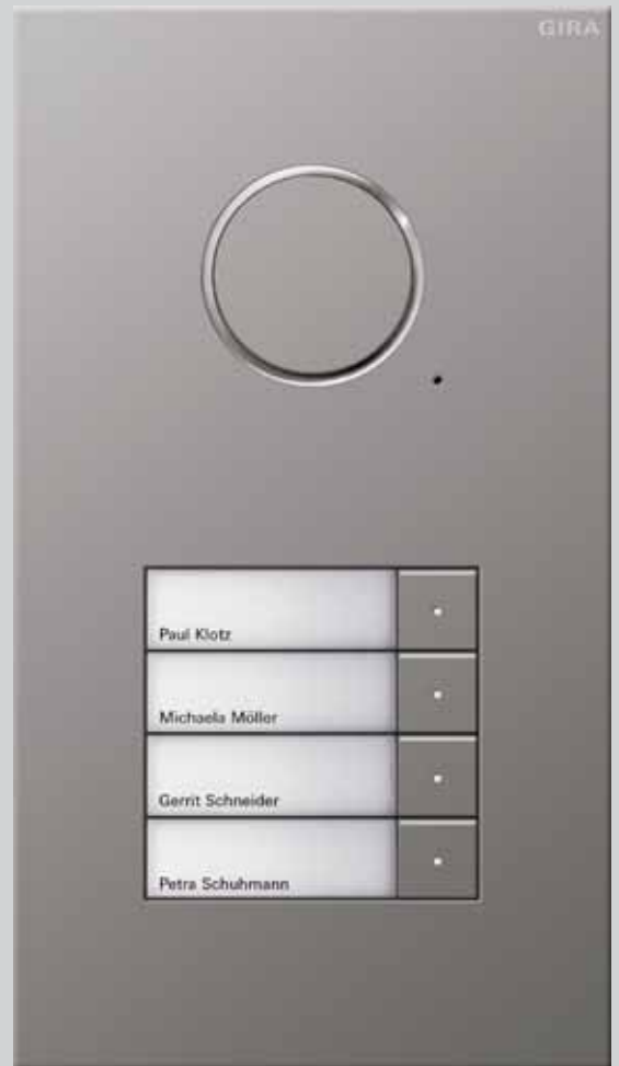
Gira Türstation Edelstahl 4fach

Dabei gibt es Materialien, die hemmungslosem Vandalismus Stand halten. Edelstahl zeigt sich als ein äußerst beständiges Metall. Seine silbrige Oberfläche wirkt zudem elegant und zeitlos, seine robuste Oberfläche hält eine Menge aus. So, wie die neue Gira Türstation Edelstahl. Sie versteckt modernste Türkommunikationstechnik hinter einer geschliffenen, drei Millimeter starken Frontplatte aus hochwertigem Niosta V2A Edelstahl. Nahezu nahtlos gehen Frontplatte und Namensschilder ineinander über. So können keine Gegenstände in Ritzen gesteckt werden und die Anlage beschädigen.