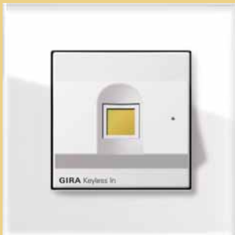
Gira Keyless In Fingerprint