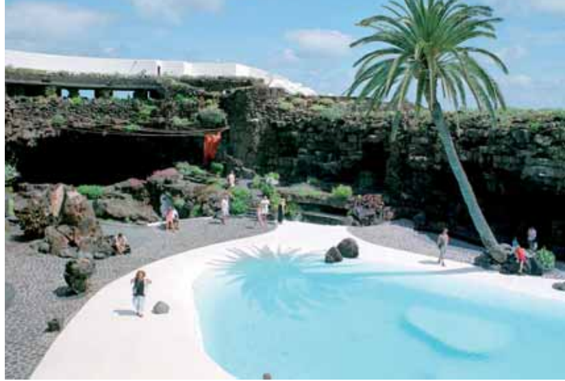
Der Eingang zu den Grotten von Jameos del Agua