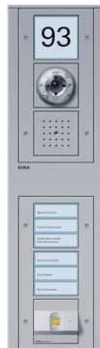
Die Keyless In Produkte passen in die Gira Energiesäule

Die Gira KeylessIn Produkte eignen sich für Ein- bis Sechs-Familienhäuser sowie kleinere, gewerblich genutzte Gebäude. Insbesondere Familien mit Kindern kommt die Technik entgegen. Statt jeden Zutrittsberechtigten mit einem Schlüssel auszustatten und einen weiteren für Notfälle beim Nachbarn zu deponieren, wird kurzerhand dessen Finger eingescannt. Das funktioniert bei Kindern genauso wie bei Erwachsenen und älteren Menschen. Die Erkennungsmechanismen der Fingerprint Leseinheit sind so ausgereift, dass nicht die oberste, sondern untere Hautschichten abgetastet werden. So funktioniert die Technik auch bei leichten Verletzungen, schmutzigen Fingern oder altersbedingten Strukturänderungen der Haut. Des Weiteren sind Garagen-, Drehkreuz- und Schrankensteuerungen sowie die Ansteuerung motorischer Schließzylinder in Haustüren usw. denkbar. Noch Fragen? Wir stehen Ihnen gern zur Verfügung.