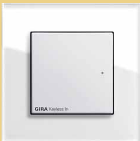
Gira Keyless In Transponder